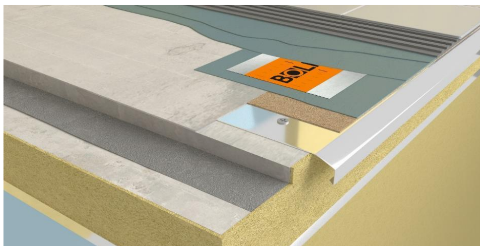
Rys.7. Schemat wykonania hydroizolacji na połączeniu obróbki z posadzką

Powierzchnię taśmy po przyłożeniu do masy uszczelniającej przetrzeć wzdłużnie czystą pacą, celem dociśnięcia oraz usunięcia ewentualnych zagięć lub bąbli powietrza. W narożach odcinki taśmy łączyć stosując zakład na całej szerokości taśmy. Tak zabezpieczone obszary pozostawić do wyschnięcia i utwardzenia na minimum 24h. Na tym etapie nie pokrywać zewnętrznej powierzchni taśmy masą HYDRO DUO, gdyż może to znacząco wydłużyć czas wiązania masy pod taśmą. Po tym czasie, zwilżyć całą posadzkę, nie tworząc kałuż. Nanieść masę BOLIX HYDRO DUO za pomocą pędzla dobrze wcierając w podłoże, w jednym cyklu roboczym powłoką o grubości ok. 1 mm. Po przeschnięciu pierwszej warstwy BOLIX HYDRO DUO, zwykle około 4-6h, całą powierzchnię balkonu pokryć drugą warstwą masy BOLIX HYDRO DUO, rozprowadzając na gładko pacą ze stali nierdzewnej. Łączna grubość dwóch warstw hydroizolacji po przeschnięciu musi wynosić 2,0 – 2,5 mm. Wykonaną powłokę należy chronić przez min. 3 dni przed opadami, oddziaływaniem wody, szybkim przesychnianiem oraz mrozem.