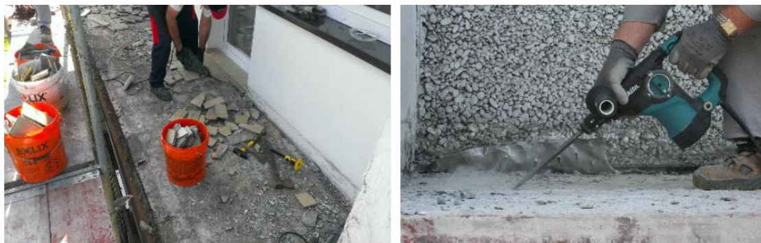
Rys.1. Przygotowanie podłoża – odsłonięcie i oczyszczenie płyty konstrukcyjnej

Wierzchnie warstwy płyt balkonowych tj. okładzina ceramiczna, fugi, kleje, bitумы, papy, hydroizolacje, zaprawy cementowe, folie oddzielające, obróbki blacharskie etc. należy usunąć aż do odsłonięcia płyty konstrukcyjnej. Elementy uszkodzonego, odspojonego, zawilgoconego lub zwietrzałego tynku płaszczyzn czołowych i podniebień płyt balkonowych należy również usunąć. Powierzchnia żelbetowej płyty balkonowej powinna być oczyszczona z elementów antyadhezyjnych tj. gruz, kurz, piasek, wykwity solne, resztki mleczka cementowego itp. Uszkodzenia żelbetu w postaci ubytków lub odsłonięcia zbrojenia stalowego należy zabezpieczyć, a ubytki uzupełnić. W tym celu w miejscu uszkodzenia odkuć wszelkie niespójne, osłabione elementy betonu. Naprawianą powierzchnię betonu powinien charakteryzować otwarty system kapilarny porów – umożliwi to poprawne związanie zaprawy szczepnej z podłożem. W uzasadnionych przypadkach, aby nadać szorstkość powierzchni zalecane jest mechaniczne frezowanie lub piaskowanie.