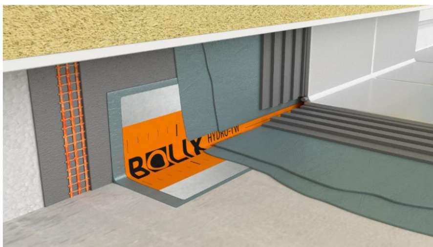
Rys.6. Schemat wykonania hydroizolacji na połączeniu ściany z posadzką