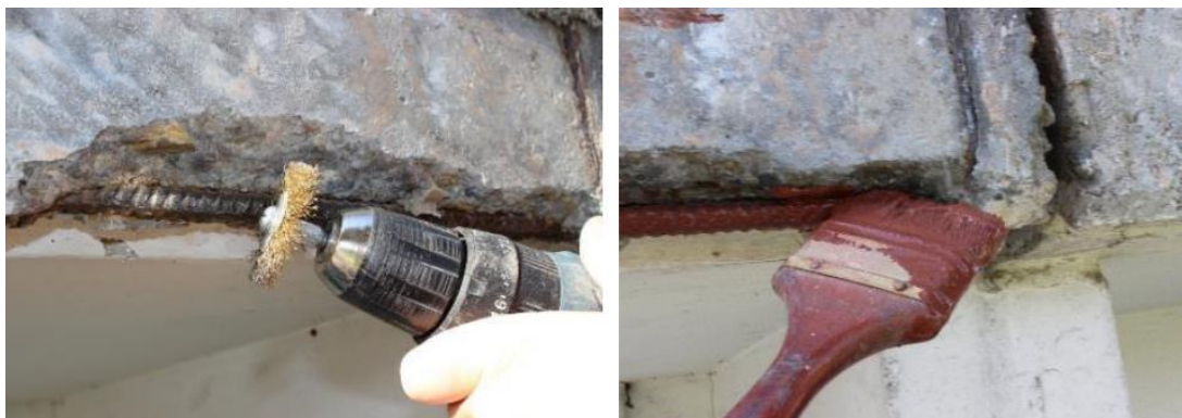
Rys.2. Czyszczenie i zabezpieczenie antykorozyjne stali zbrojącej

Skorodowane, odsłonięte pręty zbrojące, należy oczyścić mechanicznie np. za pomocą wiertarki/szlifierki ze szczotką drucianą, do stopnia czystości ST 2 lub poprzez obróbkę strumieniowo – ścierną np. piaskowanie do stopnia czystości SA 2½ wg PN-ISO 8501-1 (w praktyce oznacza to jednolitą powierzchnię bez oznak korozji lub zanieczyszczeń). Niezwłocznie po oczyszczeniu i odpyleniu powierzchnia stali powinna zostać szczelnie pokryta środkiem BOLIX AKO z zabezpieczeniem w postaci inhibitorów korozji. Jednokomponentowa, sucha zaprawa BOLIX AKO zapewnia długotrwałą ochronę przeciwkorozyjną. Wyrób w postaci suchego proszku wymieszany z czystą wodą przeznaczony jest do nanoszenia pędzlem lub szczotką. Preparat należy nanieść na całą powierzchnię zbrojenia, dwukrotnie, w odstępie ok. 3 h. Czas utwardzenia preparatu wynosi min. 5 h.