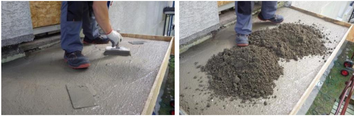
Rys.4. Wykonanie warstwy spadkowej

Wykonać wyoblenia na połączeniu płyty ze ścianą elewacji. Powyżej szlichty, na wysokość min. 30cm, wykonać izolację szlamową gr. 3mm. W tym celu, należy wykonać demontaż fragmentu warstw wykończeniowych ściany (tynk, docieplenie) na wysokość min. 30cm. Fragment wykończenia ścian odtworzyć po wykonaniu posadzki, zgodnie z detalem zamieszczonym w dokumentacji rysunkowej.